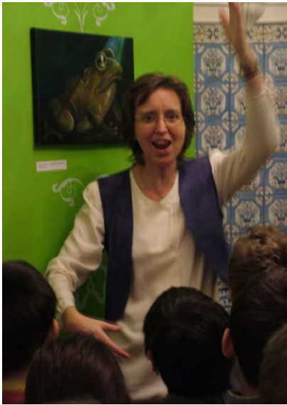
Dans les profondeurs