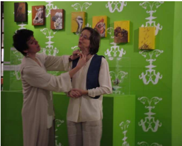
Dans la nature